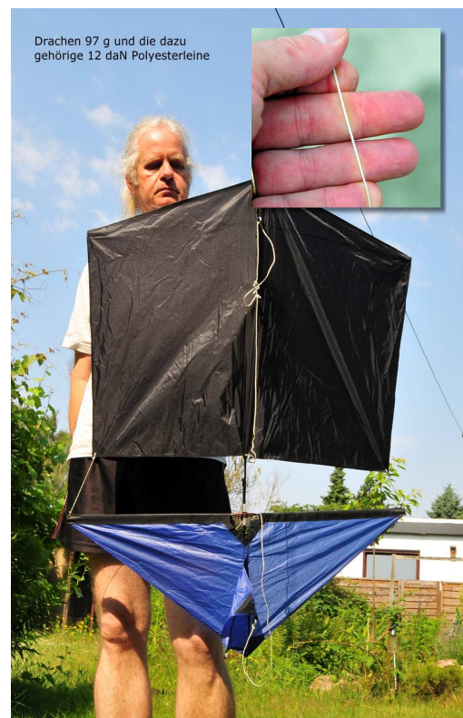
Der Drachen, die Schnur

Bitte - Seid umsichtig beim Drachensteiglassen!